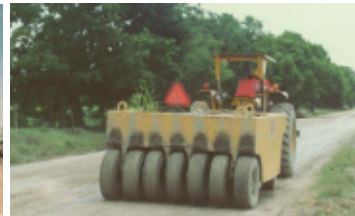
COMPACTACIÓN EQUIPO COMPACTADORA