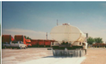
RIEGO EQUIPO CAMIÓN CISTERNA