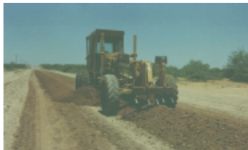
ESCARIFICACIÓN EQUIPO FRESEDORA

Se aplicará la cantidad de Top-Seal® Transparent determinada por el análisis del tipo de suelo, de manera uniforme en 3 o 4 pasadas.