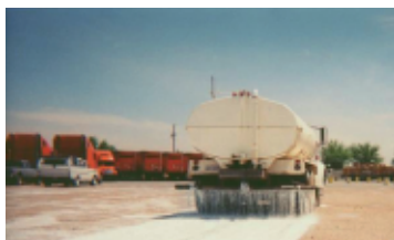
EQUIPO MANGUERA O CAMIÓN CISTERNA

Se aplicará la cantidad de Top-Seal® Transparent determinada por el análisis previo del tipo de suelo, de manera uniforme en 1 o 2 pasadas.